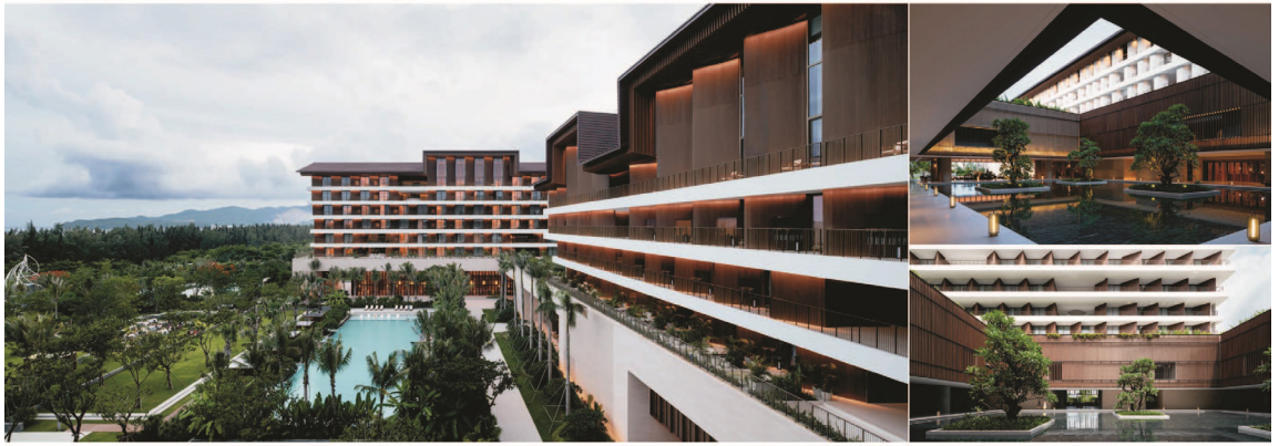
24_建筑鸟瞰图 SPECIAL SCHEME