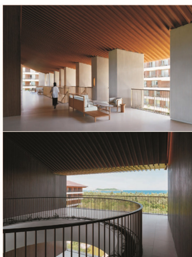
28. 特写特写 SPECIAL SCHEME