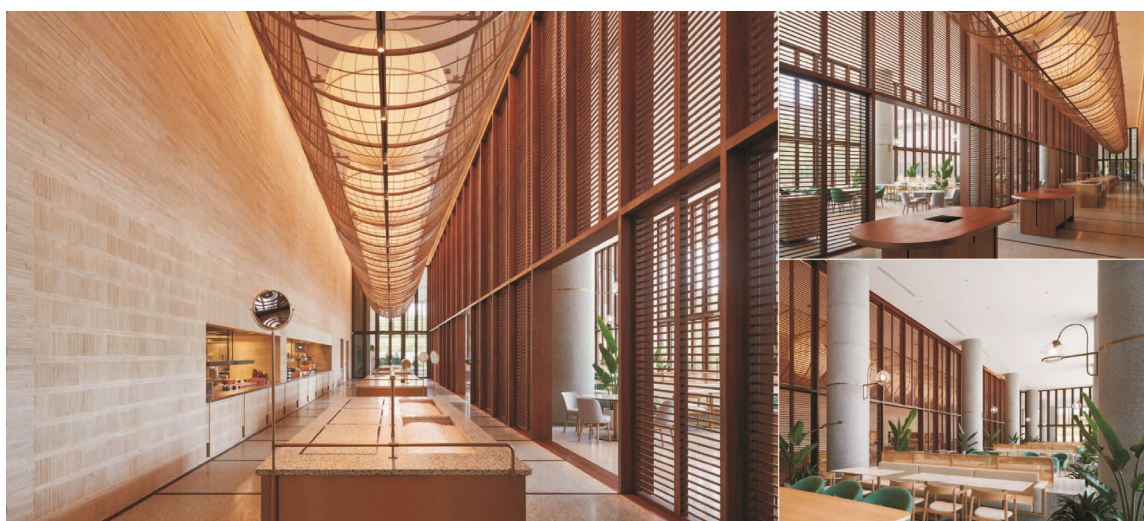
30. 特写特写 SPECIAL SCHEME