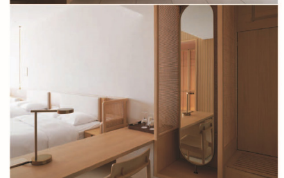
35 客房/客房特写 SPECIAL SCHEME NUMBER_35