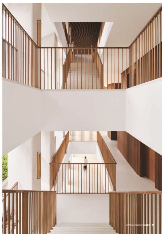
SPECIAL SCHEME 29