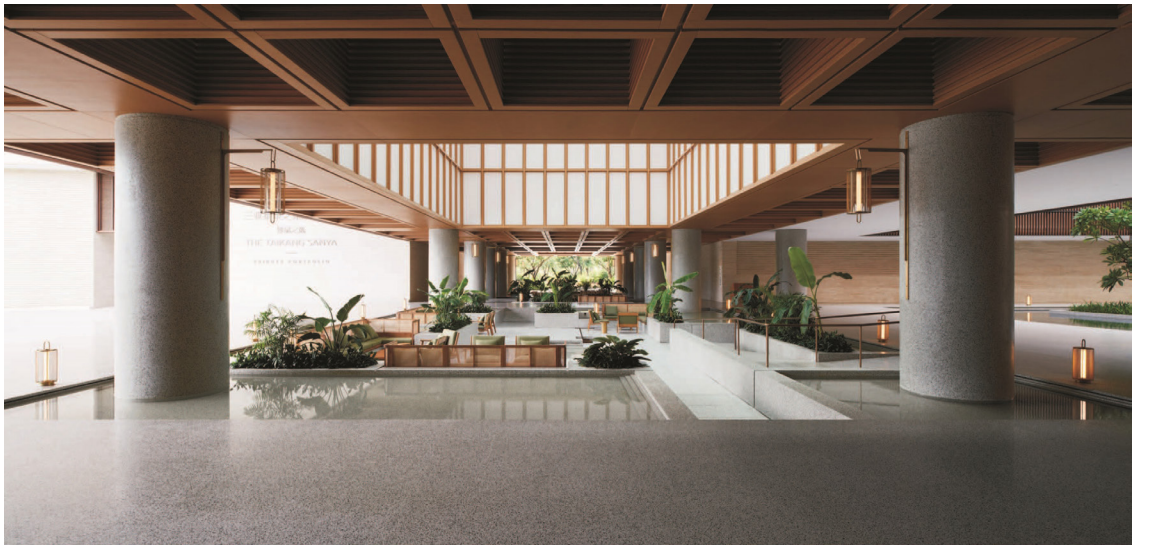
SPECIAL SCHEME 建筑透视图 25