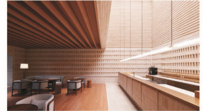
33 中庭/中庭特写 SPECIAL SCHEME NUMBER_33